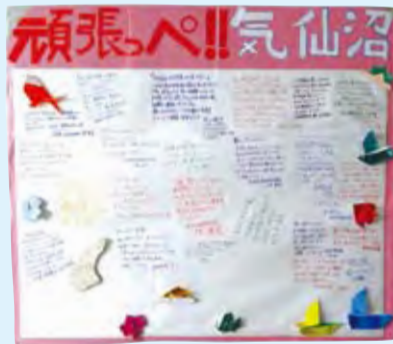
災害ボランティアセンターにある全国社協スタッフからの応援メッセージです。

被災地の復興にはまだまだ時間がかかると思われるが、自分のできる支援活動を継続していきたい。 包括支援センタースタッフ(5月9日～16日)