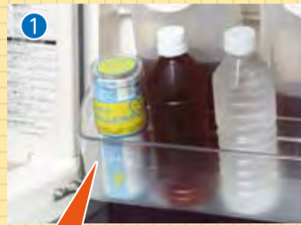
① 冷蔵庫の扉を開けて、すぐわかる場所に「カプセル」を保管します。