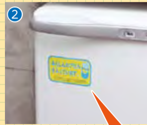
② 冷蔵庫扉の表にカプセルがあることを示す「ステッカー」を貼付します。

もしものとき本人が病状などを説明できないときに、救急隊員や地域ネットワーク委員などが活用することができます。