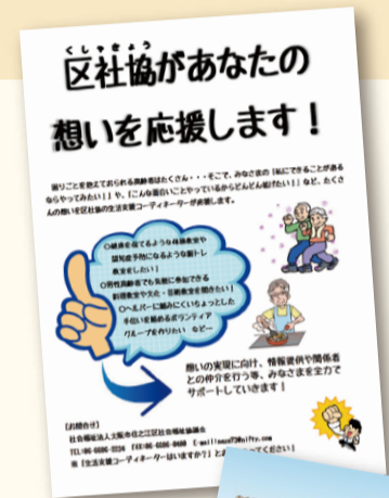
人とのつながり リーフレット

連絡先 住之江区社会福祉協議会 生活支援コーディネーター ☎06-6686-2234